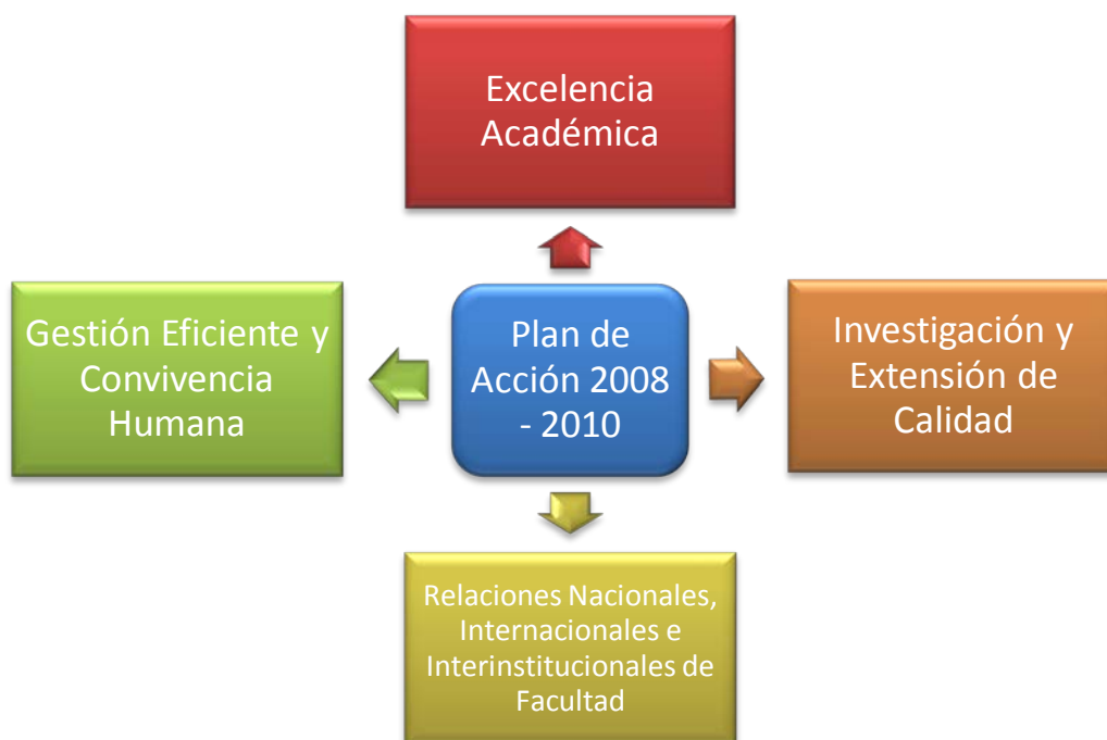
Figura 1. Ejes Estratégicos Plan de Acción

Los ejes estratégicos buscarán orientar la gestión de Facultad hacia acciones de cambio concretas, evaluables y verificables. El proceso de empalme con la administración 2006 – 2008, permitió contar con una base de aportes que sirvieron para perfeccionar el alcance de las funciones misionales universitarias en la sociedad, proporcionando estándares de calidad más altos en la formación de Enfermeros a nivel de pregrado, así como una mayor contextualización de nuestros profesionales en estudios de posgrado en distintos niveles, propendiendo por parámetros más exigentes en la investigación, una participación más activa en el desarrollo social a través de un mejoramiento de la extensión universitaria, así como una ampliación del espectro social de la Facultad a nivel nacional e internacional.