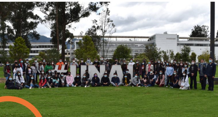
Semana de inducción Facultad de Enfermería

E n el año 2034 somos la principal universidad colombiana, reconocida por su contribución a la Nación, y por su excelencia en los procesos de formación, investigación, e innovación social y tecnológica. Nuestra capacidad de reinventarnos nos ha llevado a tener una organización académica y administrativa novedosa, flexible, eficiente y sostenible, con comunicación transparente y efectiva en su interior, con la Nación y con el mundo, y comprometida con los procesos de transformación social requeridos para alcanzar una sociedad equitativa, incluyente y en paz.