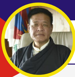
Excelentísimo Presidente Sr. Penpa Tsering Representante de la Administración Central Tibetana en el exilio